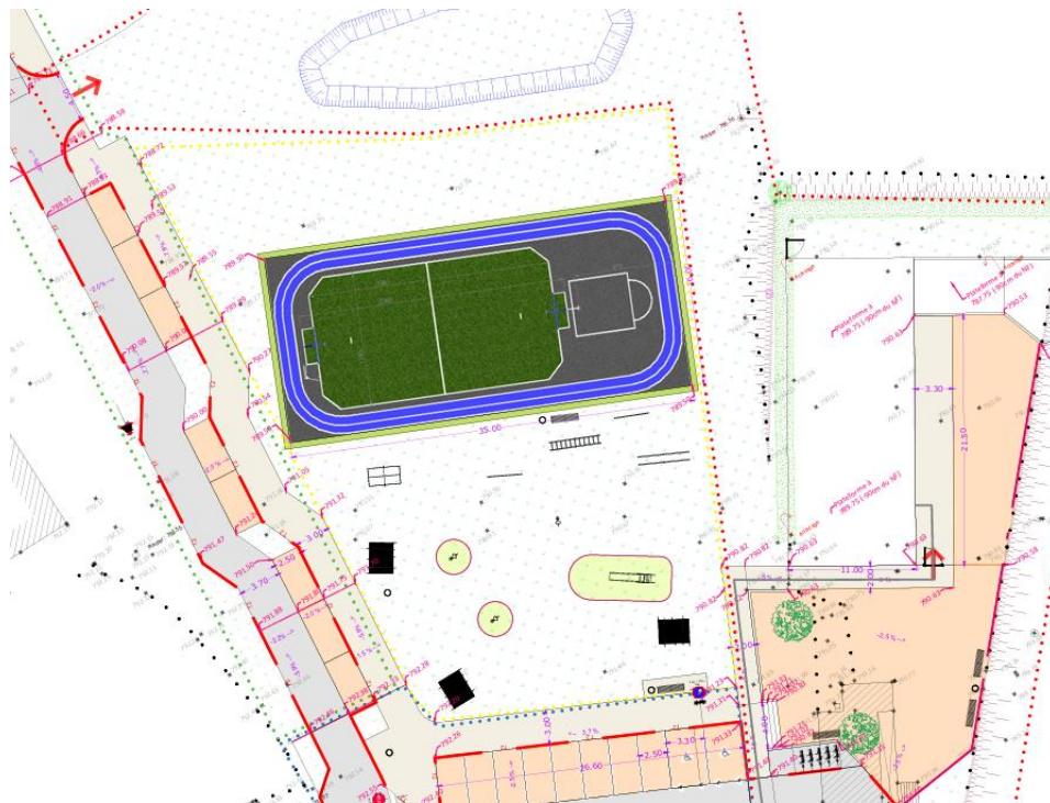
Implantation du City-stade

Le budget est en cours d'élaboration, initialement estimé à un peu moins de 220k€HT.