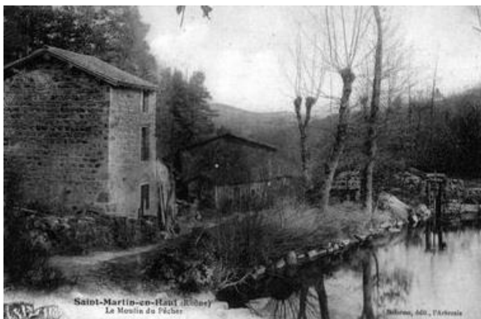
Le Moulin du Pêcheur